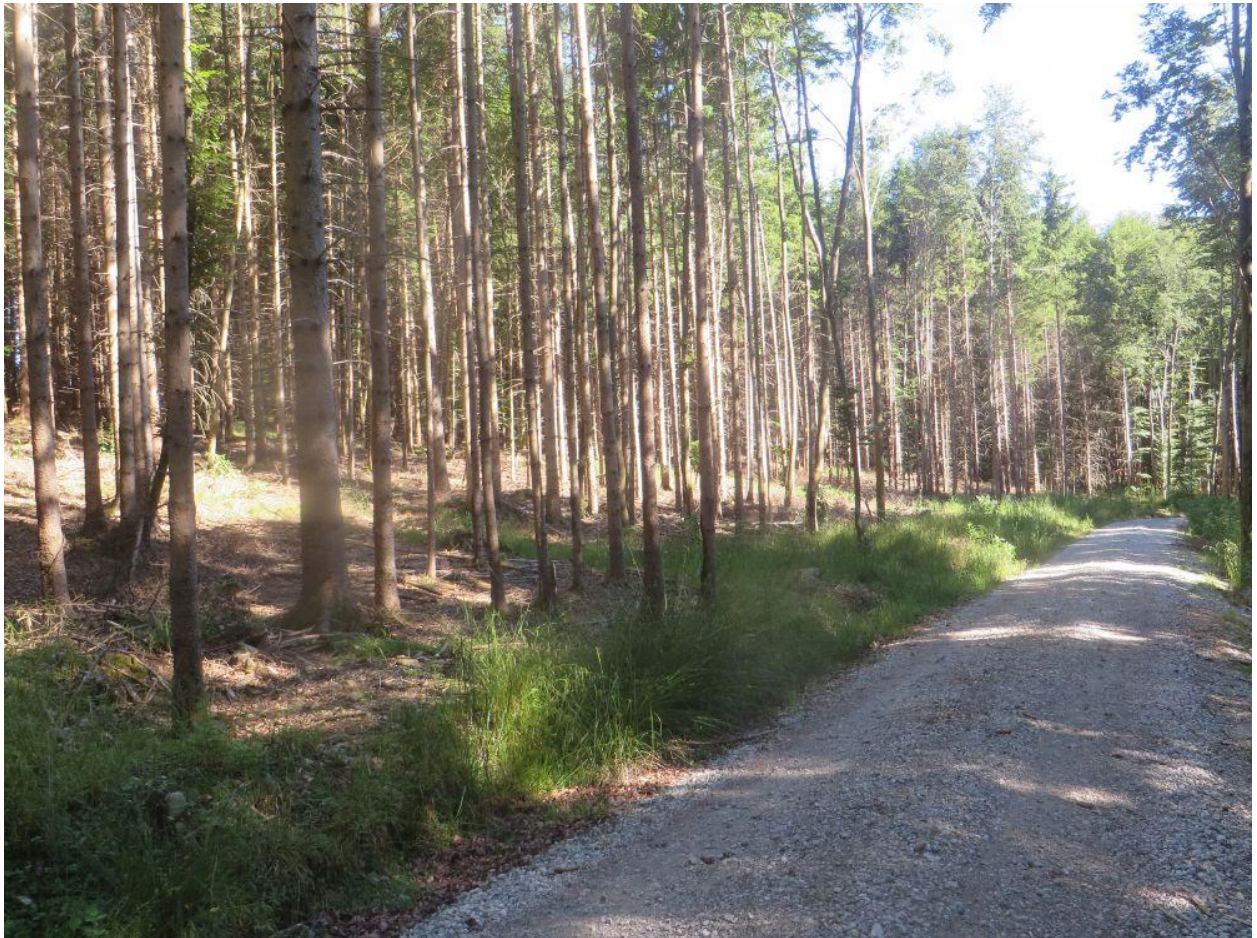
Abb. 1 Oberer Grundwald Distr. XI Abt. 5 Best. b2: nach weiterer Rücknahme der Fichte Standort für wegbegleitenden Waldinnenrand